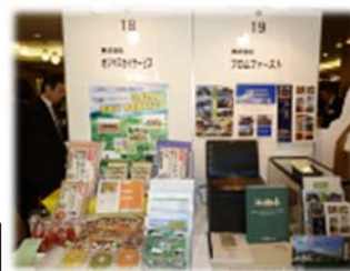
【参考】昨年の展示ブース